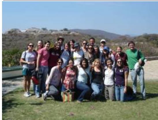
Becarios del Programa ETA en Xochicalco

Tras una conferencia sobre las Relaciones entre los Estados Unidos y Latinoamérica, presentada por la Dra. Valeria Valle del Tec de Monterrey y el Dr. Arturo Borja, CIDE; los becarios también realizaron una visita al sitio arqueológico Xochicalco, ubicado en el Estado de Morelos a una hora de la Ciudad de México.