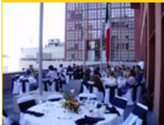
"Lunch Break" – Private lunch on the roof-top of S.R.E.