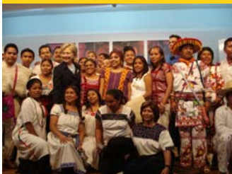
Otros estudiantes indígenas invitados al evento con Hillary Clinton, el pasado 25 de marzo.

Un jueves de marzo escuché en el noticiero televisado que existía la posibilidad de que la Secretaria de Estado de los Estados Unidos, Hillary Rodham Clinton, viniera a México. Se dijo que era sólo una posibilidad y que no había fecha exacta. Pensé que si la Secretaria nos visitaba seguramente se concentraría en problemas como el narcotráfico o la violencia en la frontera. La verdad es que con tanto trabajo en mi oficina EducationUSA de la universidad pública de Oaxaca lo olvidé ese mismo día.