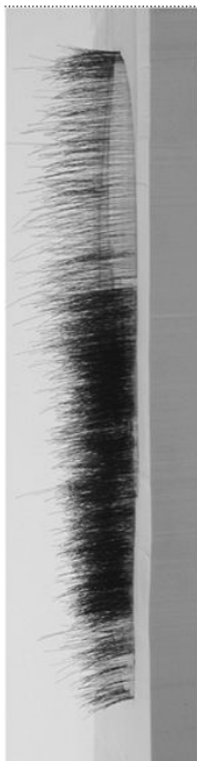
Detalle lateral de la pieza