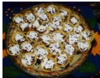
"Chilapitas"—The favorite dish of the day.