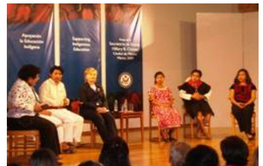
Estudiantes indígenas, representantes de diversos programas de becas del Departamento de Estado conversan con la Secretaria Hillary Clinton.

Esto es muy buena noticia para los asesores de EducationUSA , y mejor noticia para los jóvenes indígenas que sueñan con una oportunidad como la que les brindan las diferentes programas de becas como del Departamento de Estado y de COMEXUS. Para mí fue un honor representar a los ex becarios Fulbright-García Robles y tener esta pequeña charla con esta gran mujer y esta gran política. A nivel personal fue una distinción y una experiencia inolvidable que me alientan a seguir promoviendo el acercamiento y el entendimiento entre nuestros países.