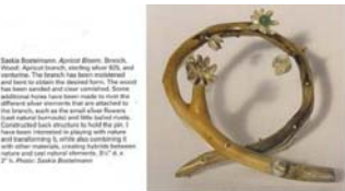
Saskia Bostelmann: "Art Jewelry Today 2".

mucha alegría pero no muchas esperanzas continué con mis actividades.