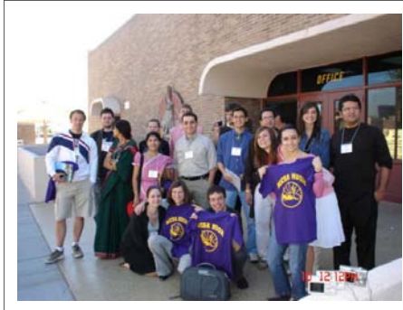
En Mays High School, Tempe, Arizona