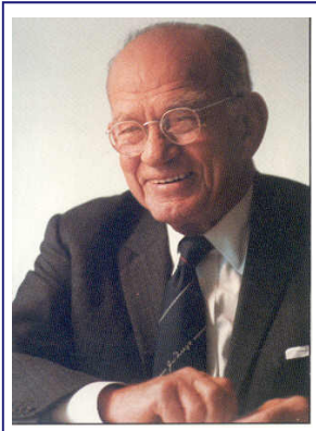
J. William Fulbright

El pasado 9 de abril celebramos el 101 aniversario del natalicio de J. William Fulbright , por cuya iniciativa nació el mundialmente conocido Programa Fulbright, y por cuya misión, esta Comisión hoy en día promueve el entendimiento entre los pueblos de México y Estados Unidos.