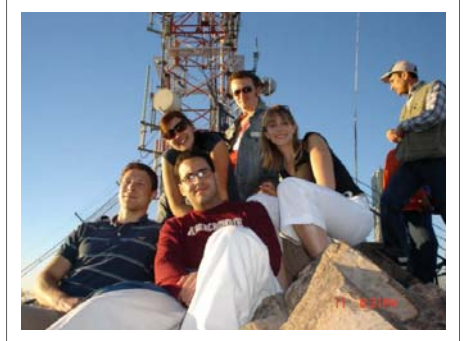
Cerro de Tempe, Arizona.

La oportunidad de interactuar con otros Fulbrighters de diferentes países cursando el primer año de estudios representa una de las experiencias más importantes para todos los becarios, lo cual convierte al seminario en una parte esencial de la experiencia como Fulbrighter.